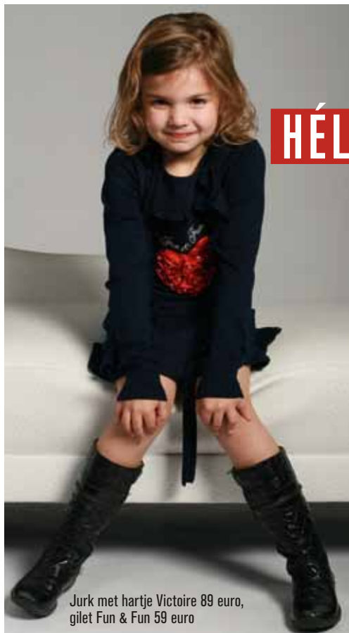
Jurk met hartje Victoire 89 euro, gilet Fun & Fun 59 euro