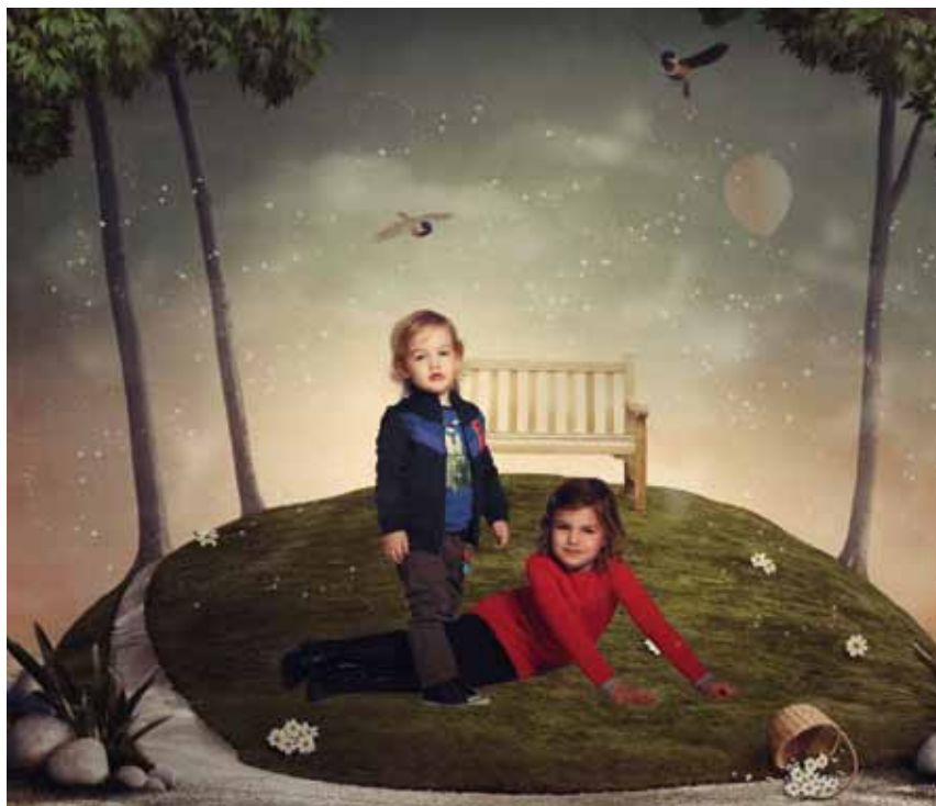
Verwerkt tot een droomwereld voor kinderen